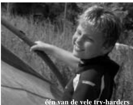
één van de vele try-harders

Anderen die reeds wat basis, eerste graad, bezaten konden hun hartje ophalen bij de tweede graad. Naast het aanleren van de “moeilijke” draaigijp, kwamen de trapezes te voorschijn om de surfhouding/kracht beter op de plank over te brengen zodat er sneller geplaneerd kon worden. Eveneens werd er bij het eilandje naarstig geoefend op de