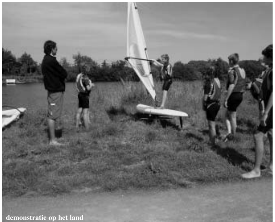
demonstratie op het land

stratie op het land, waarbij iedereen het nieuwe rustig kon inoefenen op de