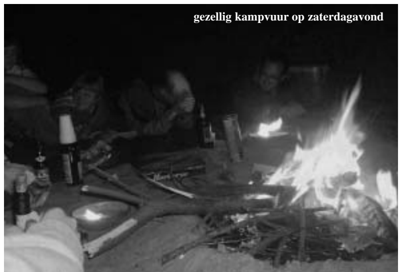
gezellig kampvuur op zaterdagavond

Zondagmorgen, het kampvuur had blijkbaar iets langer uitgelopen dan ik zelf had meegeemaakt, ene was zijn rugzak zeker gestolen uit zijn voortent en dit na 4u 's nachts??? En een andere vind in zijn tent een vreemde rugzak? Er was geen felle zon, toch wel kleine oogjes? Maar gelukkig voor sommigen was er koffie! Vervolgens ruimden we het kamp op om terug naar het water te gaan, alle vuil verzamelen... 't ja wie zijn kleren in een vuilzak steekt kan al raden waar die kleren plots in verdwenen waren zeker;-)